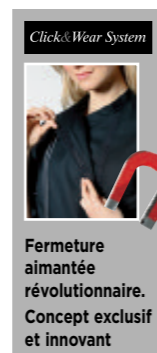
Click&Wear System Fermeture aimantée révolutionnaire. Concept exclusif et innovant

“C’est sur le long terme que se calcule la qualité d’un vêtement.”