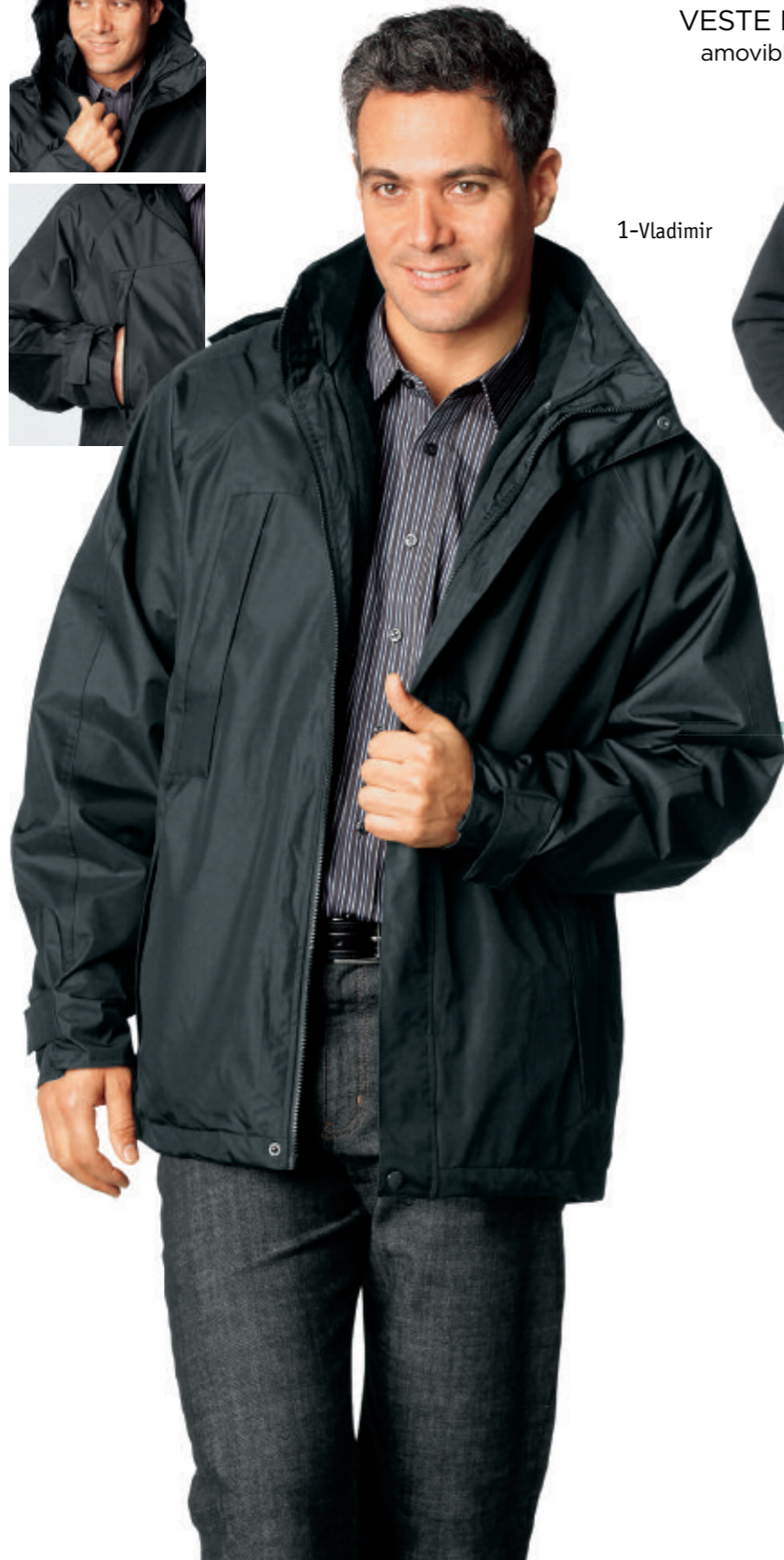
VESTE POLAIRE amovible par zip